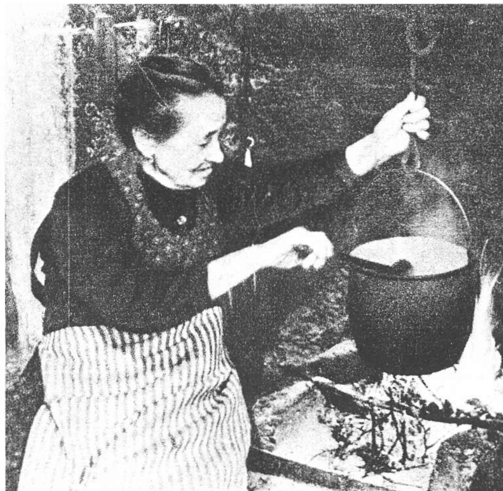
Interno dell'ex-osteria Nordera a Giazza, frequentata da doganieri e contrabbandieri