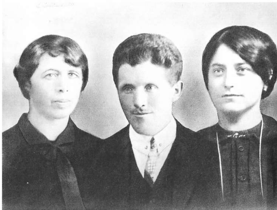
Main barba hat gamegalt tzoa baibar. Mio zio si è sposato due volte

sprechan (parlare) ctr. reidan springan (correre, saltare) springan-au (saltar su, arrabbiarsi) springan-aus (saltar fuori, darsi da fare) springan-inj (entrare scavalcando) sprutzan (spruzzare, sgorgare; -is bàssar ) stèikan (piantare, mettere a dimora) steltzan (camminare sui trampoli) stiaban (sollevare polvere) suachan, suochan (cercare, elemosinare) tragan (portare) stoazan (dare cornate, calci, inciampare) stoltzan (camminare con un piede solo, saltare per gioco)