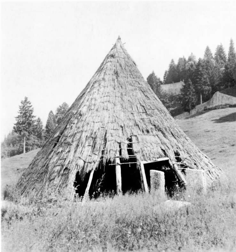
Ghiacciaie in Lessinia coperte di paglia