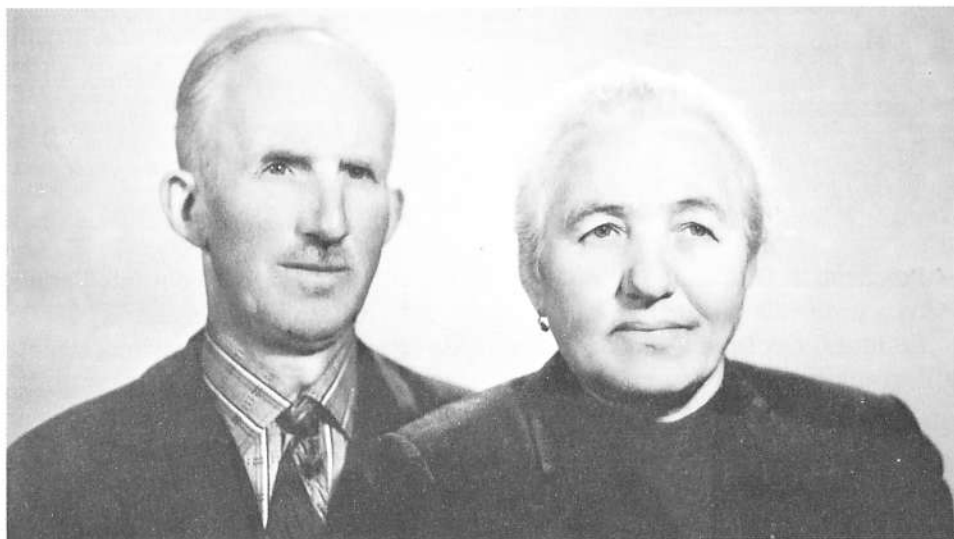
Mann un baip 'un Abato coniugi di Badia Calavena

Guarda di sforzarti a fare sempre il bene.