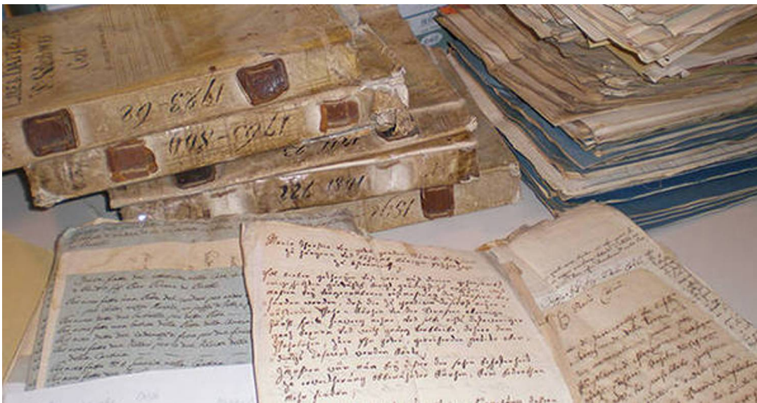
Registri parrocchiali - Symbolbild

Ora è possibile accedere online ai registri parrocchiali sudtirolesi dall'anno 1565 fino al 1923.